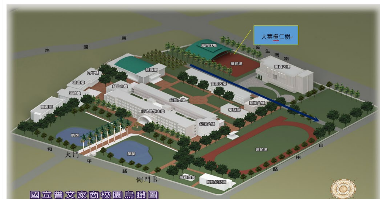
規劃設置基地空拍圖