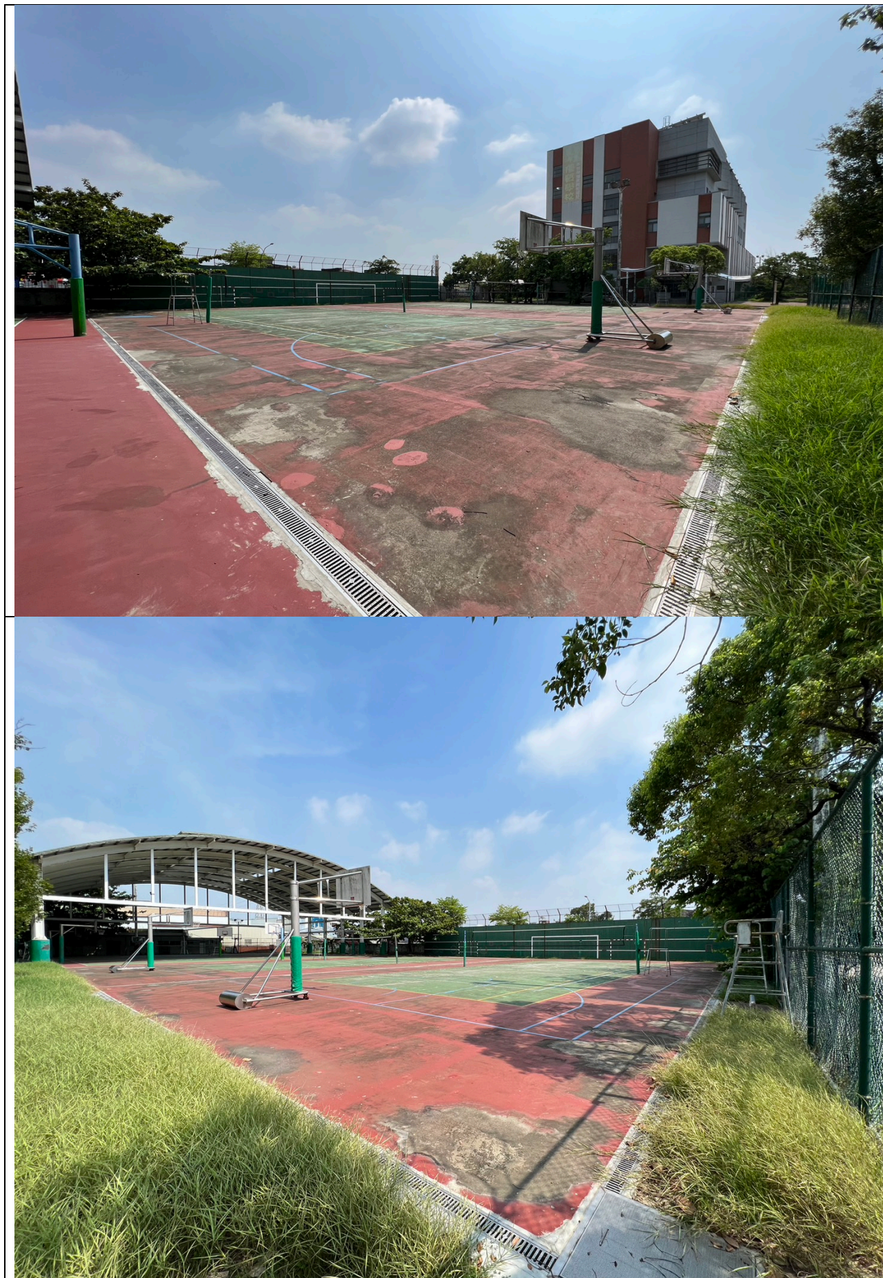
附件三：太陽能光電運動場現況圖